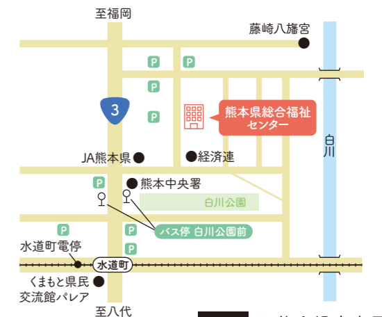
参考 研修会場案内図