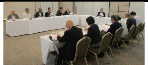
【第2回理事会の様子】