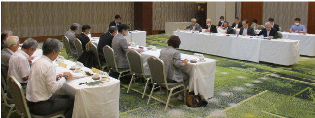
【定時評議員会の様子】

6月7日(金)に第1回理事会、27日(木)に定時評議員会を開催し、(1)令和5年度事業報告、(2)令和5年度一般会計等収支決算、(3)令和6年度一般会計等補正予算などの議案が承認されました。なお、令和5年度は、次の主要項目に取り組みました。