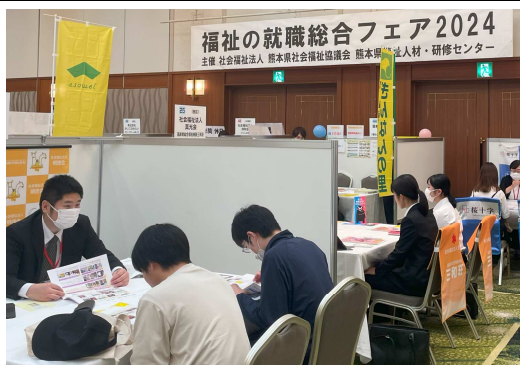
【フェア会場の様子】

その後、48法人の面談ブースにおいて、求職者や、専門学校等の学生たちと、仕事の内容や求人の詳細、働き方について積極的に会談を行っていました。